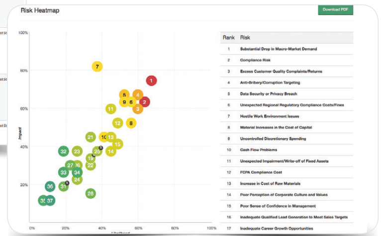
Figure 2: 戦略リスクヒートマップ